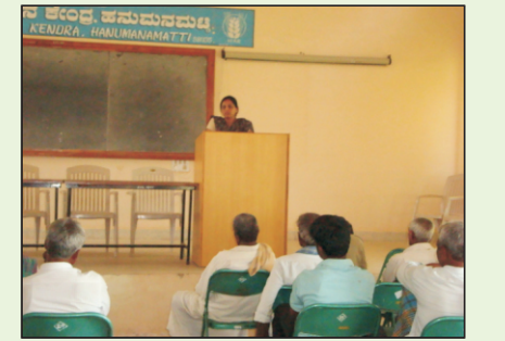
ಕಿರುಧಾನ್ಯಗಳ ಬೇಸಾಯ ಕ್ರಮಗಳು