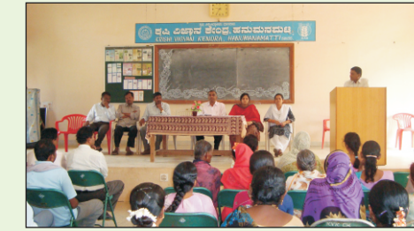
ಸಾವಯವ ಕೃಷಿಯಲ್ಲಿ ಸಸ್ಯರೋಗಗಳ ನಿರ್ವಹಣೆ