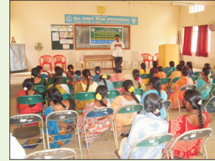
ಮಣ್ಣು ಮತ್ತು ಬೀಜದಿಂದ ಬರುವ ಸಸ್ಯರೋಗಗಳ ನಿರ್ವಹಣೆ